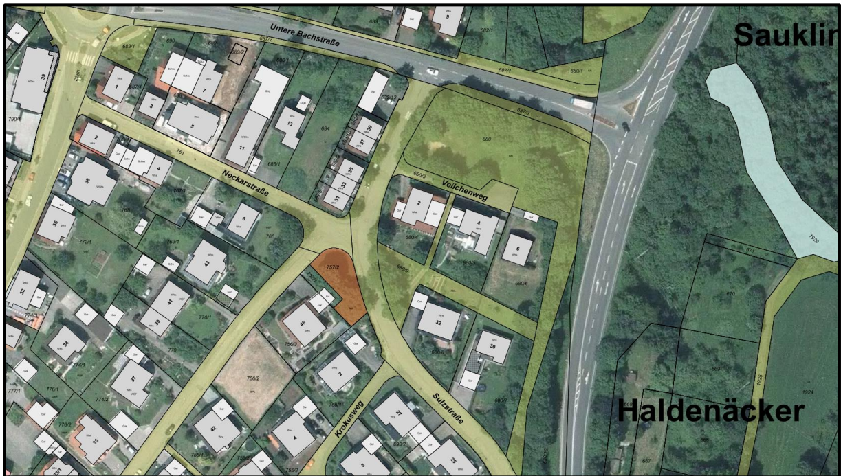
Flst. Nr. 757/2, Gemarkung Pliezhausen, Ecke Sulzstraße - Nelkenstraße