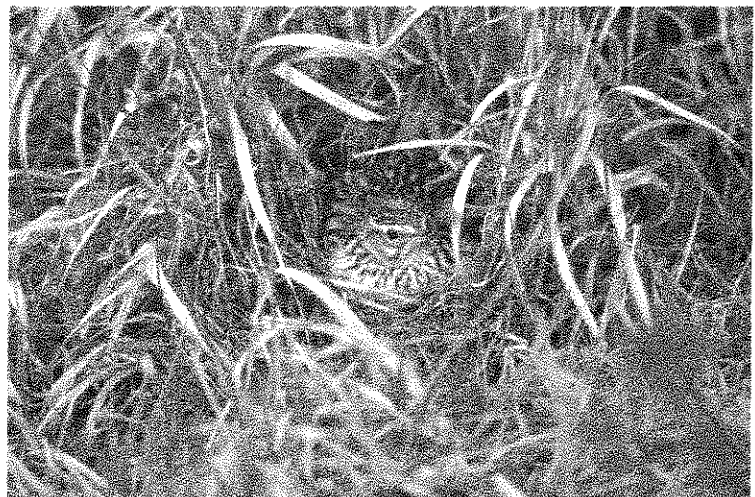
Foto Heidelerche, brütend