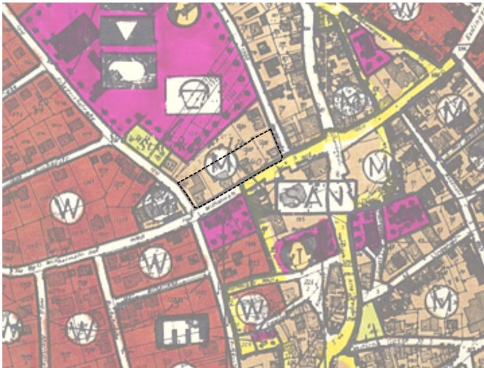
Ausschnitt genehmigter FNP mit Geltungsbereich Bebauungsplan, ohne Maßstab

Im genehmigten FNP ist die Fläche des Planbereichs als gemischt genutzte Baufläche dargestellt und entspricht damit der im Rahmen der Planänderung erfolgenden Festsetzung als „Urbanes Gebiet“ nach § 6a BauNVO.