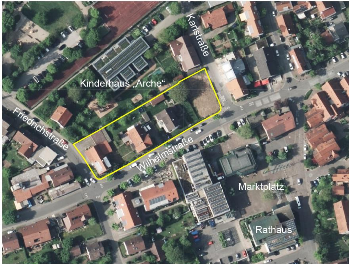
Luftbild mit Geltungsbereich Bebauungsplanänderung, ohne Maßstab

Das Plangebiet liegt im Ortskern von Pliezhagen, unmittelbar nördlich gegenüber dem zentralen Handels-, Dienstleistungs- und Verwaltungsstandort um den Marktplatz. Nördlich des Plangebiets befindet sich das Kinderhaus „Arche“, daran anschließend das Gelände des „Otwin Brucker Schulzentrums“.