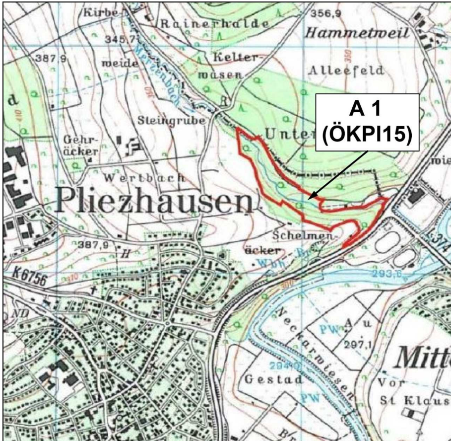
Kartengrundlage: TK 25 Blatt 7421 Metzingen (LGL 2010)