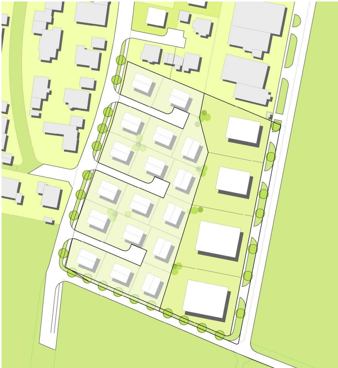
Städtebaulicher Vorentwurf V 1.4, 16.03.2018, Büro citiplan