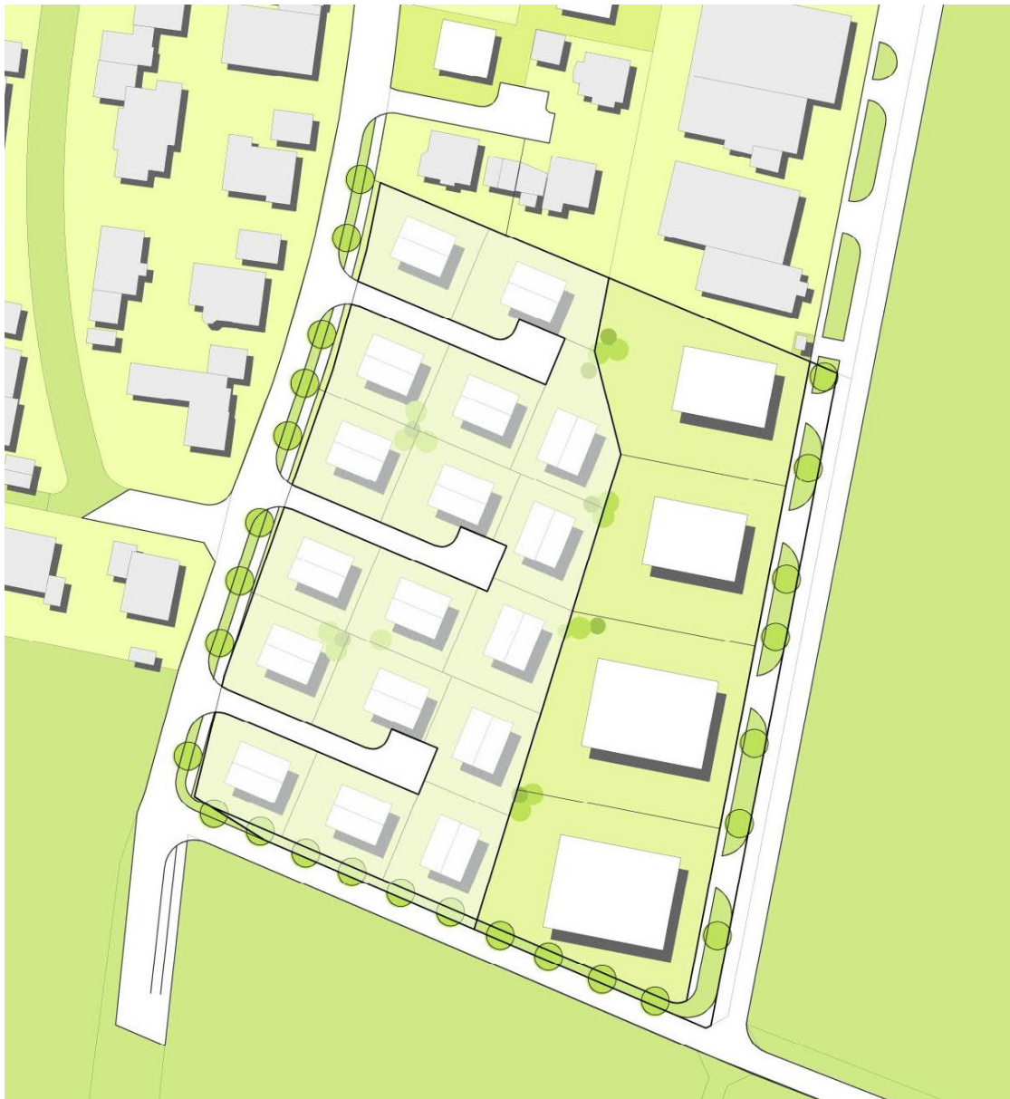
Städtebaulicher Vorentwurf V 1.4, 16.03.2018, Büro citiplan